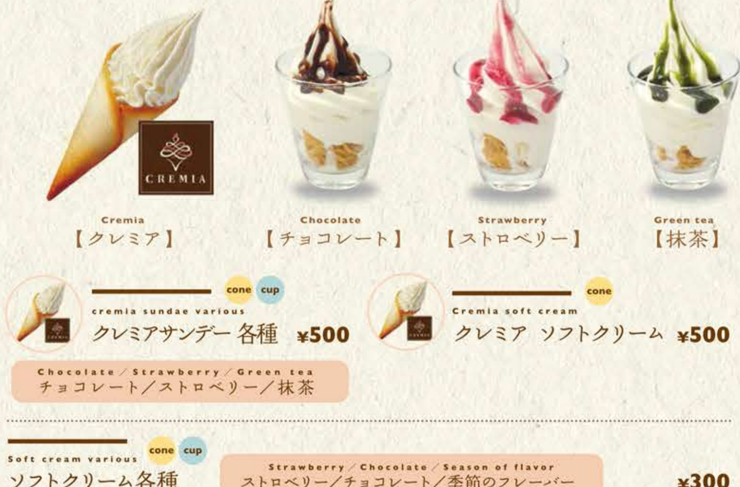
Soft cream sundae various クレミアサンデー各種 ¥500