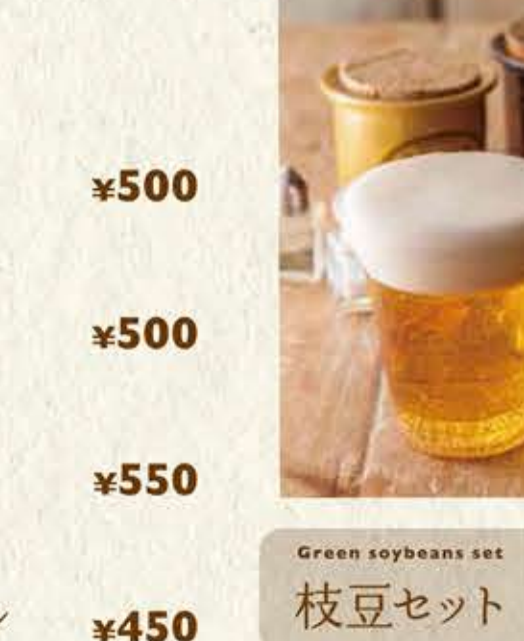
Green soybeans set 枝豆セット +¥200