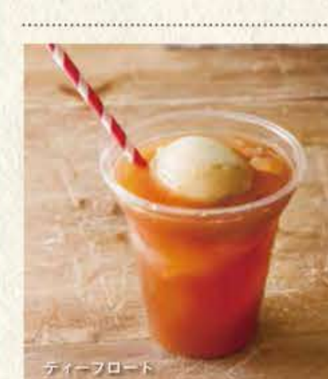
float ALL ¥380 +¥120 クレミアフロートにございます Tea / Coffee / Cake ティー / コーヒー / コーラ Melon soda メロンソーダ