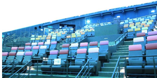
直径23m まるちたいけんドーム

東京都足立区の体験型複合施設「ギャラクシティ」のまるちたいけんドーム(プラネタリウム)では、「LIFE いのち」の上映&特別コンサートを実施いたします。