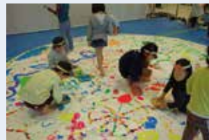
昨年のワークショップの様子

時 2/25(日) 10:00~16:00、3/4(日) 10:00~13:00 対 4歳~10歳のお子様(小学3年生以下は保護者同伴) 定 12名 申 2/10(土)~事前申込 講 ミロコマチコ(絵本作家)